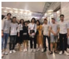
ベトナムの空港で見送られた写真