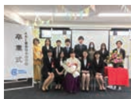
日本語学校を卒業した写真