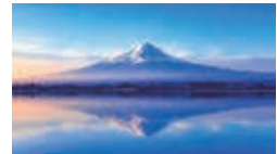
七月 富士山 標高：3776m