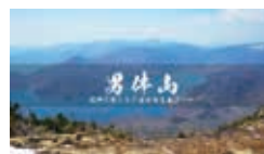
五月 男体山 標高：2486m