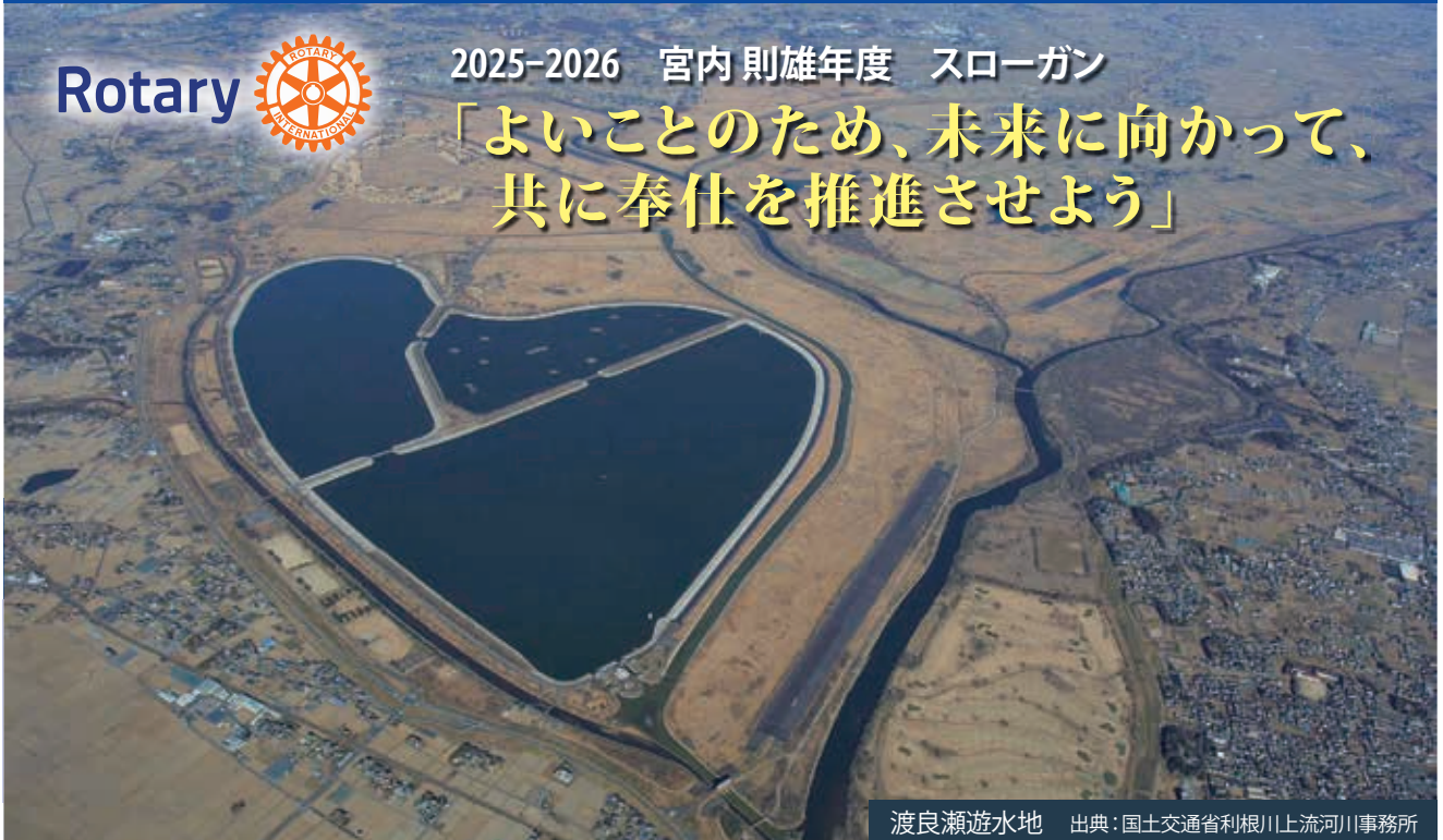
渡良瀬遊水地