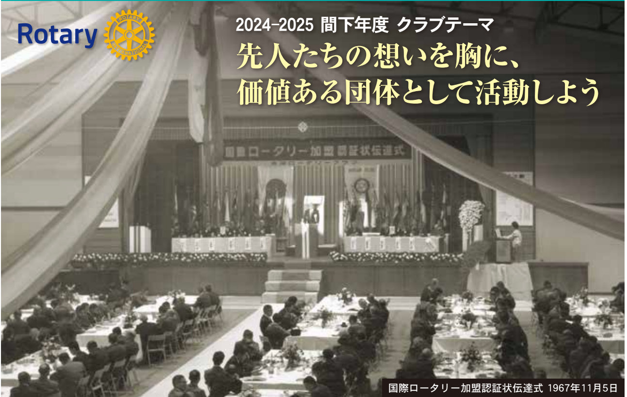
国際ロータリー加盟認証状伝達式 1967年11月5日