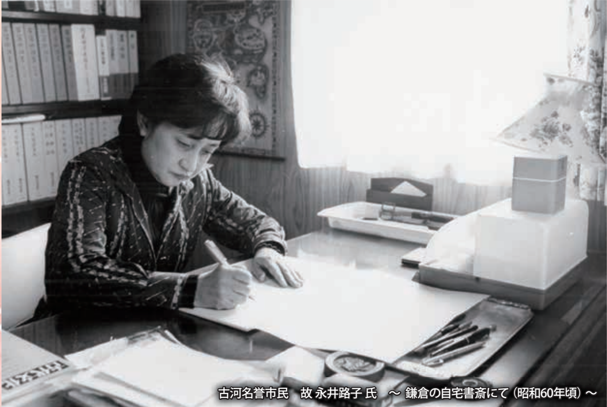
古河名誉市民 故 永井路子氏 ～ 鎌倉の自宅書斎にて(昭和60年頃)～