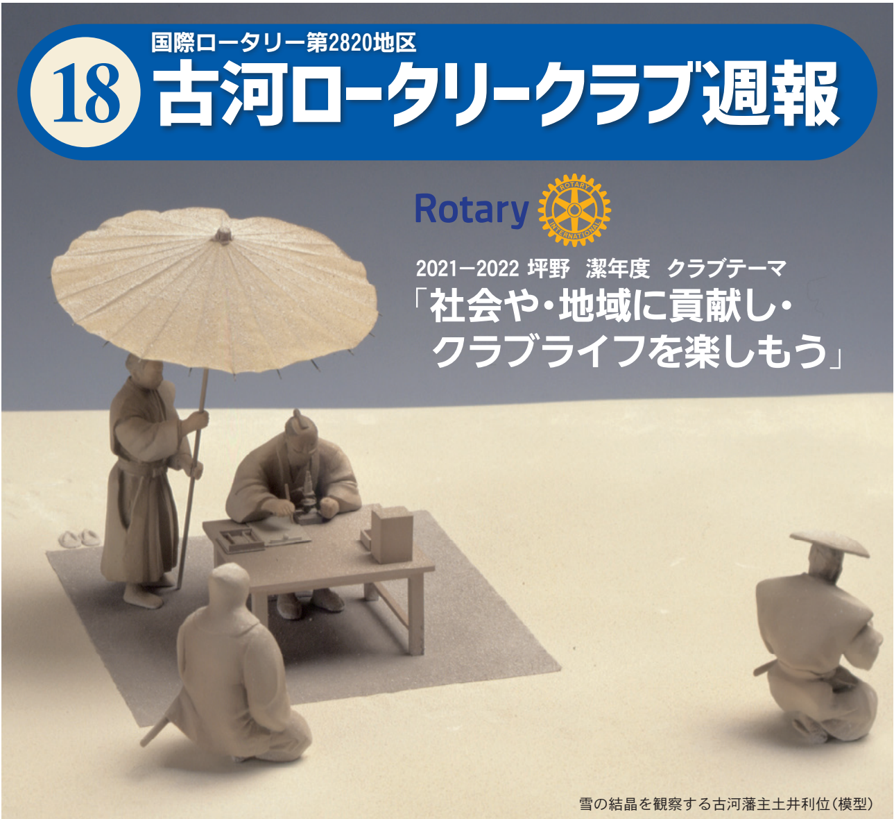
雪の結晶を観察する古河藩主土井利位(模型)

2021-2022 坪野 潔年度 クラブテーマ 「社会や・地域に貢献し・ クラブライフを楽しもう」