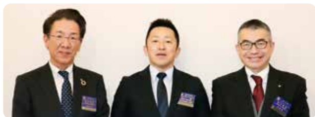
いつも笑顔でお出迎えいただき、ありがとうございます。