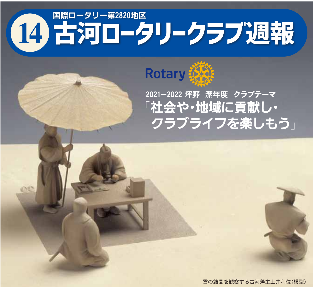
雪の結晶を観察する古河藩主土井利位(模型)

2021-2022 坪野 潔年度 クラブテーマ 「社会や・地域に貢献し・ クラブライフを楽しもう」