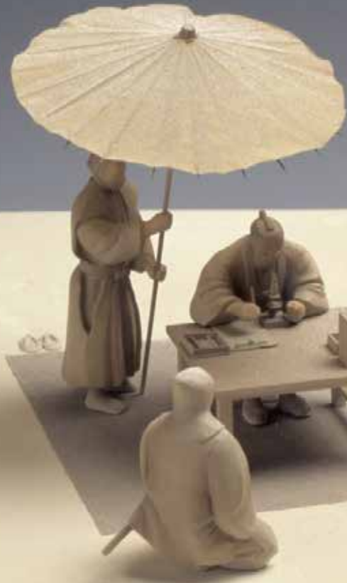
雪の結晶を観察する古河藩主土井利位(模型)