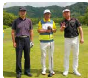
OUT 4 組目