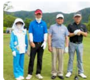
OUT 2 組目