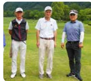
OUT 3 組目