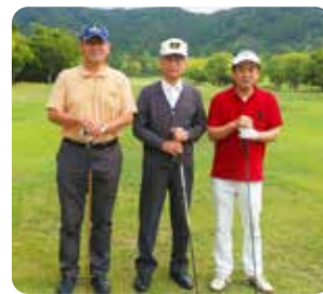
OUT 1 組目