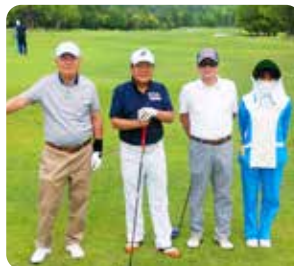
IN 2 組目