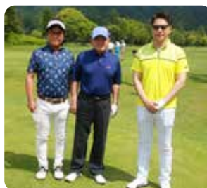
IN 5 組目