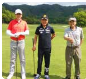
IN 1 組目