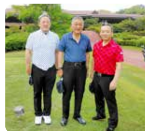
OUT 5 組目