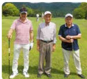
IN 4 組目