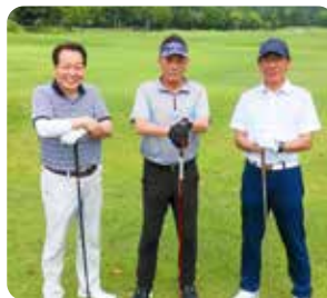
IN 3 組目